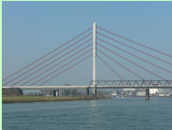
Die alte und die neue Weseler Rheinbrücke, fotografiert während des Schulausfluges zum Jubiläum (Grollik)