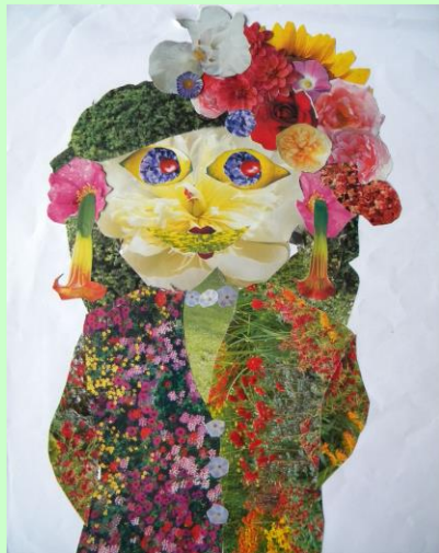
Schülerarbeit: Auseinandersetzung mit Arcimboldo