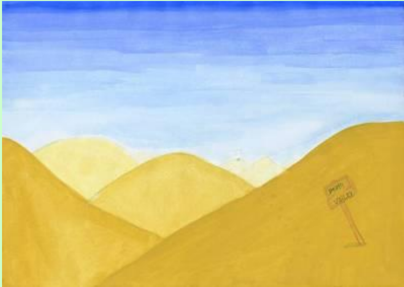
Schülerarbeit: Raumtiefe durch Aufhellung von Farben