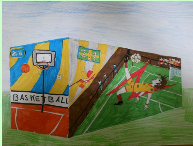
Schülerarbeit: Farbige Außengestaltung der Sporthalle (hier als Übereckperspektive)