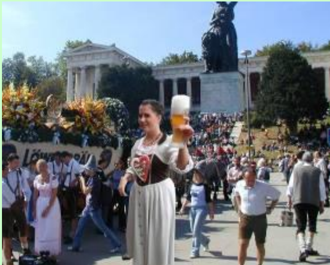
Schülerarbeit: Bildmontage einer Selbstdarstellung und eines Oktoberfestmotivs