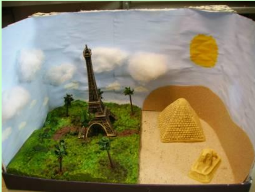
Schülerarbeit: meine Traumwelten in einem Schuhkarton