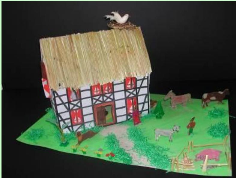
Schülerarbeit: Der Traum vom Landleben