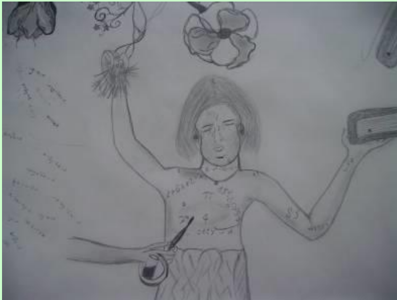
Schülerarbeit: Meine Bildwelt zwischen Naturwissenschaften und Lesen (Ausschnitt)