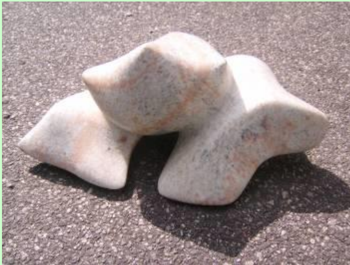
Schülerarbeit: Handschmeichler aus Seife