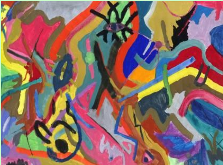
Schülerarbeit: expressive Abstraktion